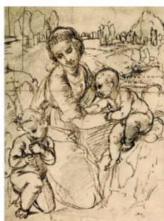
Rafaël, szkic do obrazu Madonna z Dzieciątkiem i Świętym Janem Chrzycielem , piórko i tusz, ołówek na papierze, 28,4 x 19 cm, Galeria Uffizi we Florencji, XVI w.

Niektórzy twórcy, zanim przystąpią do właściwej pracy, wykonują wiele szkiców przygotowawczych. W ten sposób określają wygląd elementów dzieła i ich kompozycję. Ukończona praca często różni się od początkowych rysunków, ponieważ artyści wprowadzają zmiany w trakcie tworzenia.