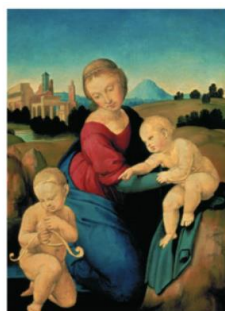
Rafaël, Madonna z Dzieciątkiem i Świętym Janem Chrzycielem , olej na drewnie, 28 x 22 cm, Muzeum Sztuk Pięknych w Budapeszcie, XVI w.