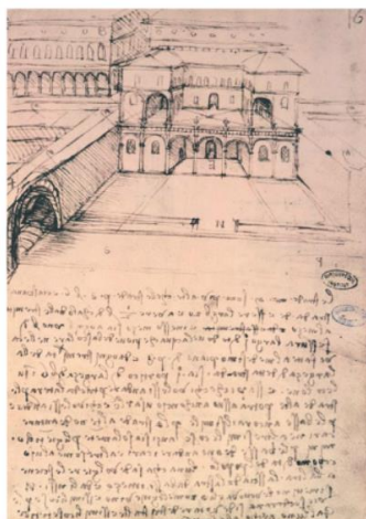
Leonardo da Vinci, szkic architektoniczny, tusz na papierze, Biblioteka Instytutu Francuskiego w Paryżu, XV w.

Warto wiedzieć: Aby uniknąć wrażenia nieporządku w rysunku, nie powinno się nakładać na siebie linii biegnących w więcej niż w dwóch kierunkach.