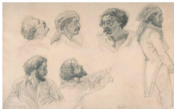
Théodore Géricault [czyt.: teodor żeriko], sześć studiów do obrazu Tratwa Meduzy

Fragmenty ludzkiego ciała i detale elementów przedstawiane są głównie w technikach rysunkowych. Dzięki studiom rysunkowym artyści przygotowują się do pracy nad obrazami oraz doskonalią umiejętności.